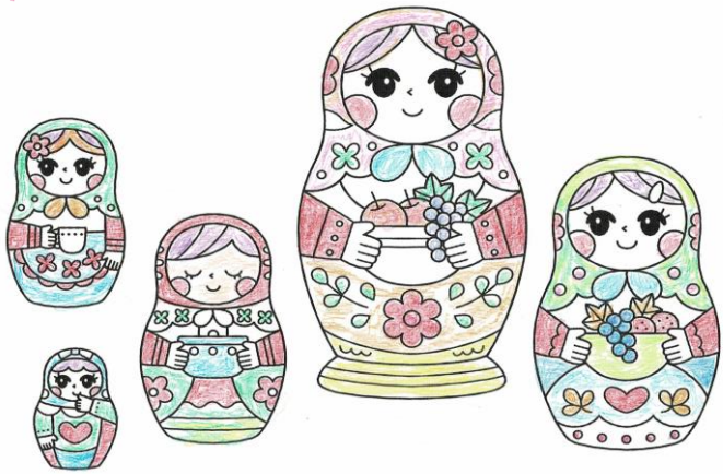
こちらのイラストは当院入院患者様の塗り絵作品です◎